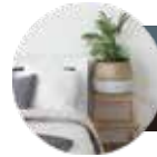
Interior green インテリアグリーン

お家の中で一番くつろげる空間にしたい寝室。グリーンをワンポイントで置くだけで、癒しの空間を作り出してくれます。