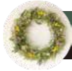
Flower wreath フラワーリース

ガラスの器にドライフラワーを入れ、アロマオイルを少し加えれば、見た目だけでなく、香りも楽しめるインテリアに。