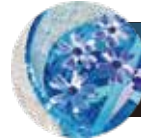
Water float flower ウォーター フロートフラワー

色々なお花を組み合わせたフラワーリースをお部屋の壁に掛けておくだけで、パッと明るい印象に。ドライフラワーを使ったリースもおおすすめです。