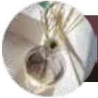
Aroma flower アロマフラワー

ガラスの器にドライフラワーを入れ、アロマオイルを少し加えれば、見た目だけでなく、香りも楽しめるインテリアに。