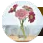
Bottle flower ボトルフラワー

ワインボトルや透明なビンに花を飾るだけでさわやかな印象に。ガラス玉やアクセサリを入れて楽しむことも。