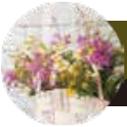
Bucket flower バケットフラワー

藤のカゴなどに花を飾れば、落ち着いた雰囲気。玄関のちょっとしたスペースにもピッタリ。